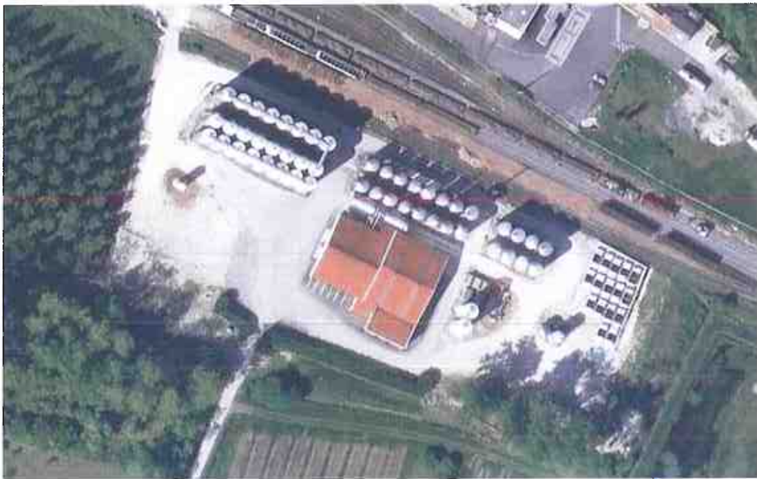
Vues aériennes du site

Un plan de masse, à l'échelle de 1/500 ème , indique les dispositions projetées de l'installation ainsi que, le tracé des réseaux enterrés existants, les canaux, plans d'eau et cours d'eau. L'extrait suivant montre une vue aérienne du site il y a quelques années :