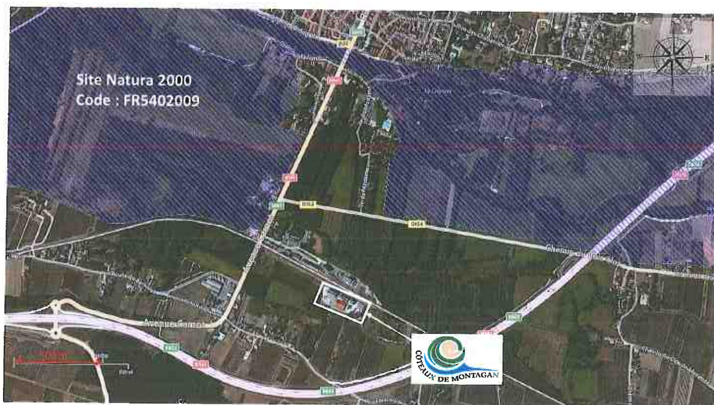
Figure 1 : Zone Natura 2000

Le site n'est pas dans le périmètre d'une zone Natura 2000. Toutefois, il est situé à environ 300 m à l'Ouest du site d'intérêts communautaires FR5402009 (Directive Habitats).